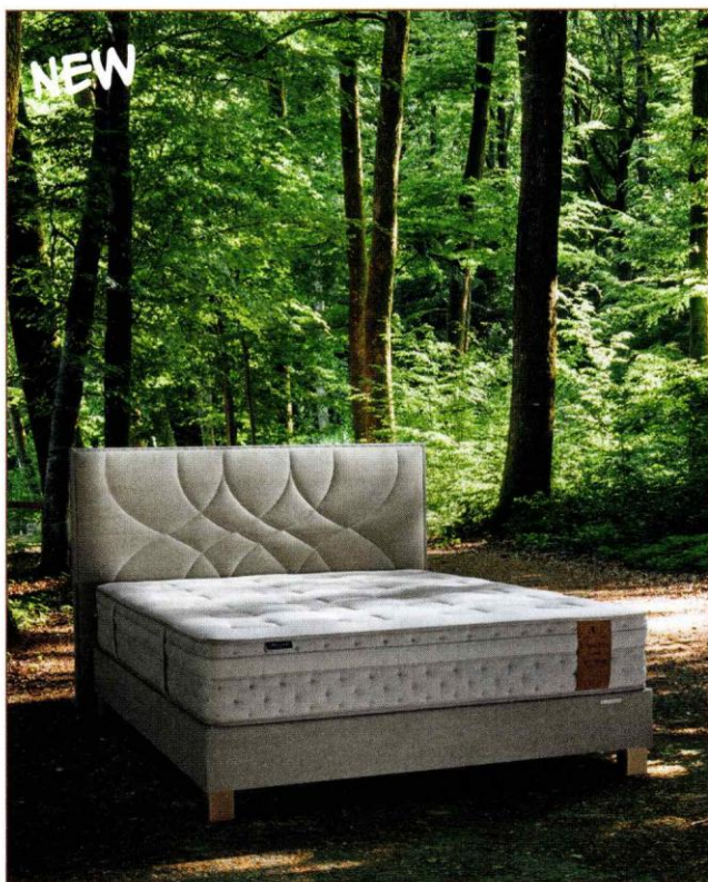
«Canopée», 95 % de matériaux recyclés ou naturels, prix sur demande. André Renault

Housse de couette en lin, 299 € en 240 x 220 cm. Couleur Chanvre