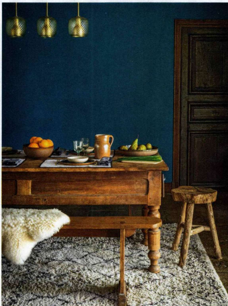
Brunch dominical. Dans la salle à manger de la Grange, on se retrouve autour d'un bon repas préparé par le chef et son équipe. Vaisselle Serax et Søstrene Grene, linge de maison Madura et Maison de vacances, peau de mouton Ikea.