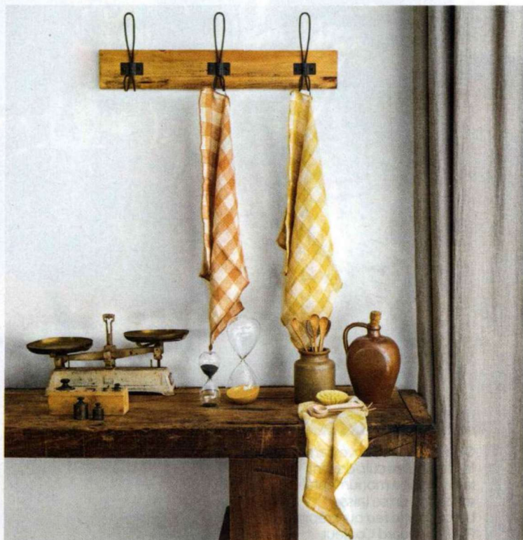
Comme à la ferme. Objets chinois et mélange de teintes naturelles égaient l'ancien établi en bois brut de la Grange. Serviettes et torchons Maison de vacances.