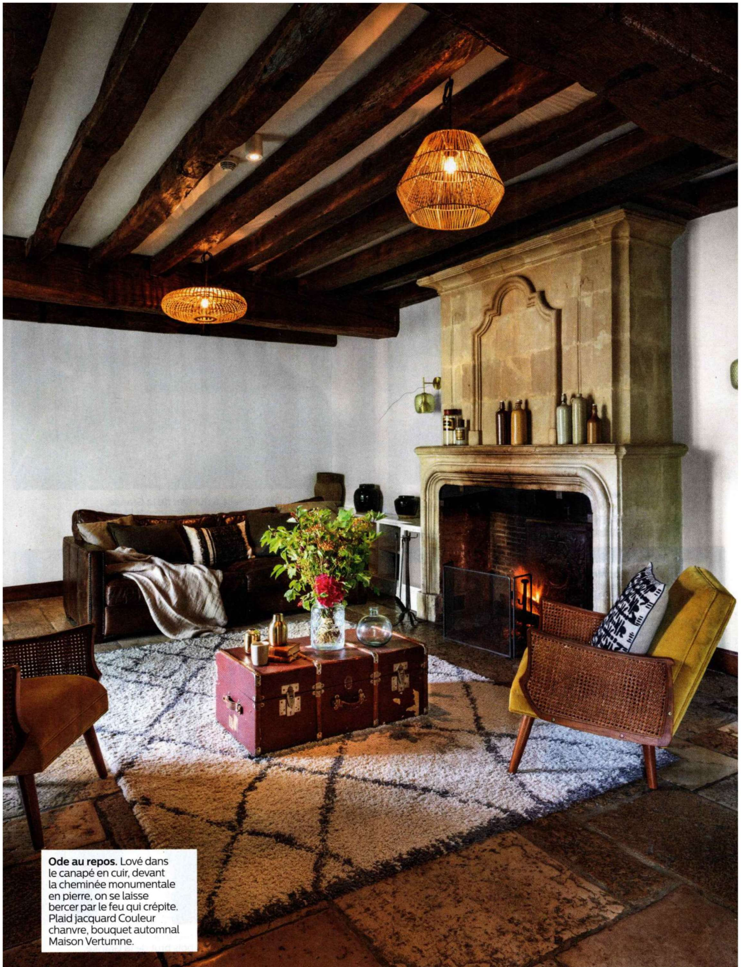
Ode au repos. Lové dans le canapé en cuir, devant la cheminée monumentale en pierre, on se laisse bercer par le feu qui crépite. Plaid jacquard Couleur chanvre, bouquet automnal Maison Vertumne.