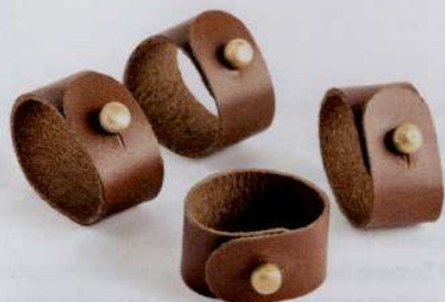
Ronds de serviette en cuir de buffle, 8,49 € les trois. La Redoute.

Si l'usage des matériaux naturels est de mise, les objets s'habillent en priorité de leurs teintes d'origine. Les bruns, les gris, les ocres et les beiges sont donc très présents. Mais la couleur n'est pas exclue de la table. Les verts, les bleus et les jaunes se déclinent en belles nuances plutôt sourdes, avec une discrétion qui évoque l'usage de pigments eux aussi d'origine naturelle.