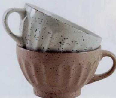
Tasses en grès d'inspiration vintage. 11,90 € les deux. Aubry Gaspard chez La Redoute.