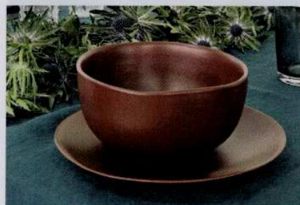
Formes minimalistes imparfaites et couleur terracota. Collection Fjord, 39,90 € les 4 bols. Maison Tilleul chez Decoclico.

Dans cette démarche artisanale, à l'authenticité des matériaux s'ajoute celle des méthodes fabrication qui donnent forme aux objets. Un mot d'ordre : le fait-main. En découlent des lignes imparfaites, des inégalités, des rugosités, des finitions plus rudimentaires, qui toutes signent l'intervention de la main humaine dans le processus de création, par opposition à la rigueur froide de la machine.