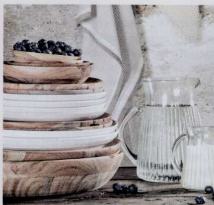
Ces assiettes, en bois d'acacia, apportent une touche très nature à la table. À partir de 16 €. IB Laursen chez Love Creative People.