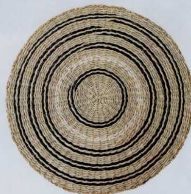
Set de table en jonc de mer Ø 38 cm. Collection 2020. 10,90 €. Bloomingville.