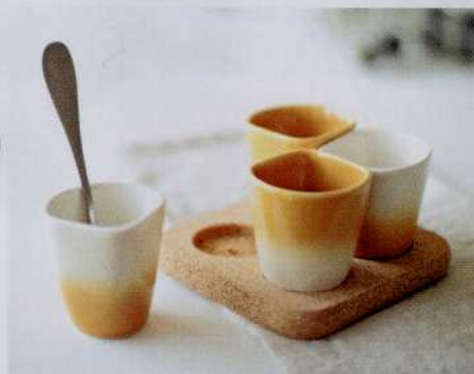
Du soleil en toute saison avec ces tasses à café habillées d'un dégradé jaune curry/blanc. Copus, 39 €. Lusa Luso.