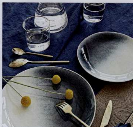
Couleur dégradée pour cette gamme de vaisselle en grès craquelé. Waldou, 39,99 € les 4 assiettes plates. La Redoute.

Longtemps associé aux environnements campagne, l'artisanat explore aujourd'hui des contrées bien plus lointaines. Ainsi l'esprit craft voit-il ses atouts décoratifs démultipliés. S'il s'exprime toujours dans le style rustique traditionnel, avec des effets de coulures ou des teintes dégradées, il séduit aujourd'hui en version ethnique : fibres tressées, bois sculpté, motifs africains... La vogue rétro-vintage s'en empare elle aussi. Les motifs terrazzo en sont un bel exemple. Quant aux amateurs de minimalisme, japonais, scandinave ou d'inspiration slowlife, ils sont comblés par les seuls effets des matières brutes. Associées à une note dorée ou à la transparence du cristal, celles-ci savent même prendre une dimension raffinée pour une table chic, voire sophistiquée. Le craft serait-il la nouvelle marque du luxe ?