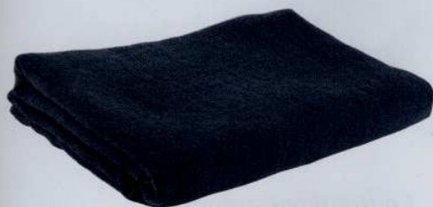
Une table élégante avec cette nappe confectionnée dans un très beau lin cultivé en Normandie. 99 €. Couleur Chanvre.