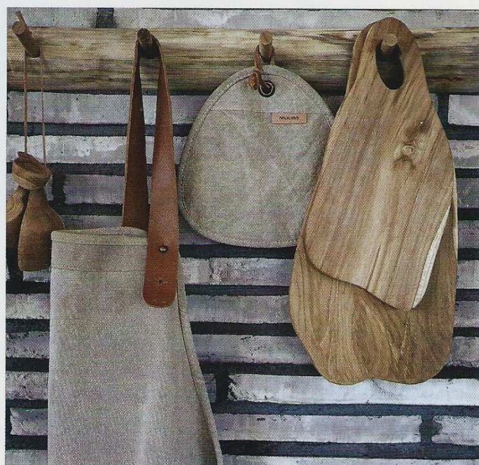
Manique en toile couleur sable avec accroche en cuir. L. 21 x l. 21 cm. 31 € le lot de 2. Muubs.

Sensible à la matière, le courant japonais honore les aspérités et les textures marquées. Murs abîmés, vaisselle imparfaite, végétal tressé à la main, il est important de se laisser porter par le témoignage d'usure et d'irrégularité des pièces que l'on fait entrer chez soi. La céramique, et les créations faites main en général, tiennent une place primordiale dans cette esthétique qui renie l'uniformité des productions en série. Point de départ de cette ambiance qui renonce au superflu : des lignes minimalistes, une palette de tonalités naturelles et des matières brutes ; un trio fusionnel pour un retour à l'essentiel assumé. ■