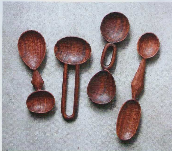
Cuillères en bois fabriquées à la main. Ariele Alasko.