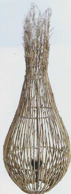
Cette lampe, en bambou, est un petit morceau de nature intacte. H. 90 x Ø 32 cm. 175 €. Muubs.