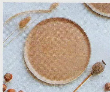
Assiette à dessert en grès émaillé. 22 €. Laurette Broll. Brutal.

S'il y a bien une pièce dans laquelle le bois s'illustre également, c'est la cuisine où s'expose une sélection d'ustensiles – cuillères, planches, assiettes, bols... taillés dans du noyer, du chêne massif ou bien de l'olivier.