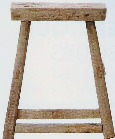
Tabouret en bois d'orme. 239 €. Bloomingville. Petite Lily Interiors.