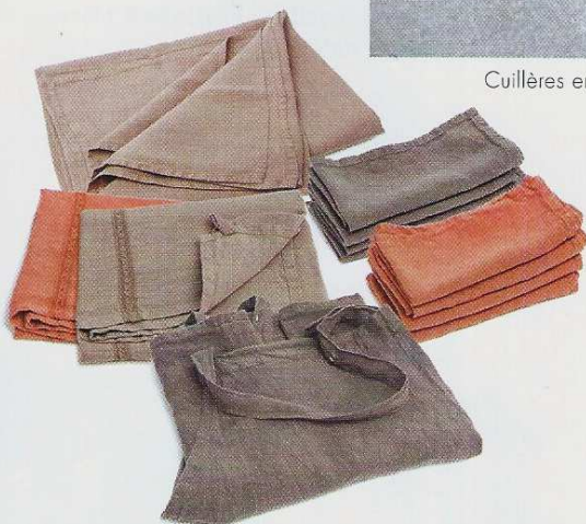
Ligne de linge en chanvre pur. Teinture écologique. À partir de 19 € le torchon. Couleur Chanvre.