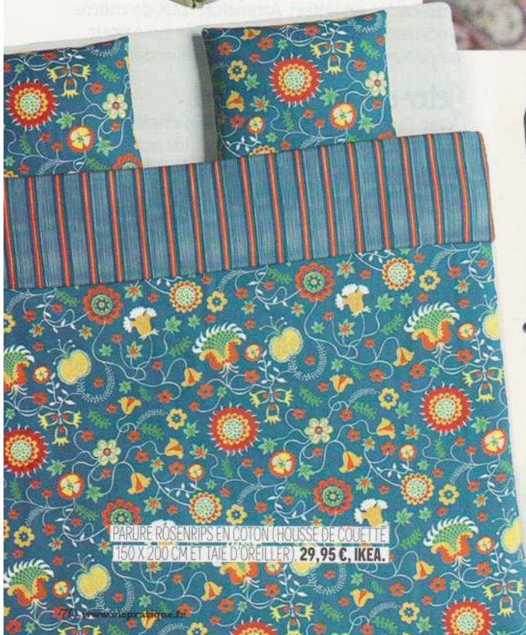
PARURE ROSENRIPS EN COTON (HOUSSE DE COUETTE 160 X 200 CM ET TAIE D'OREILLER), 29,95 €, IKEA.