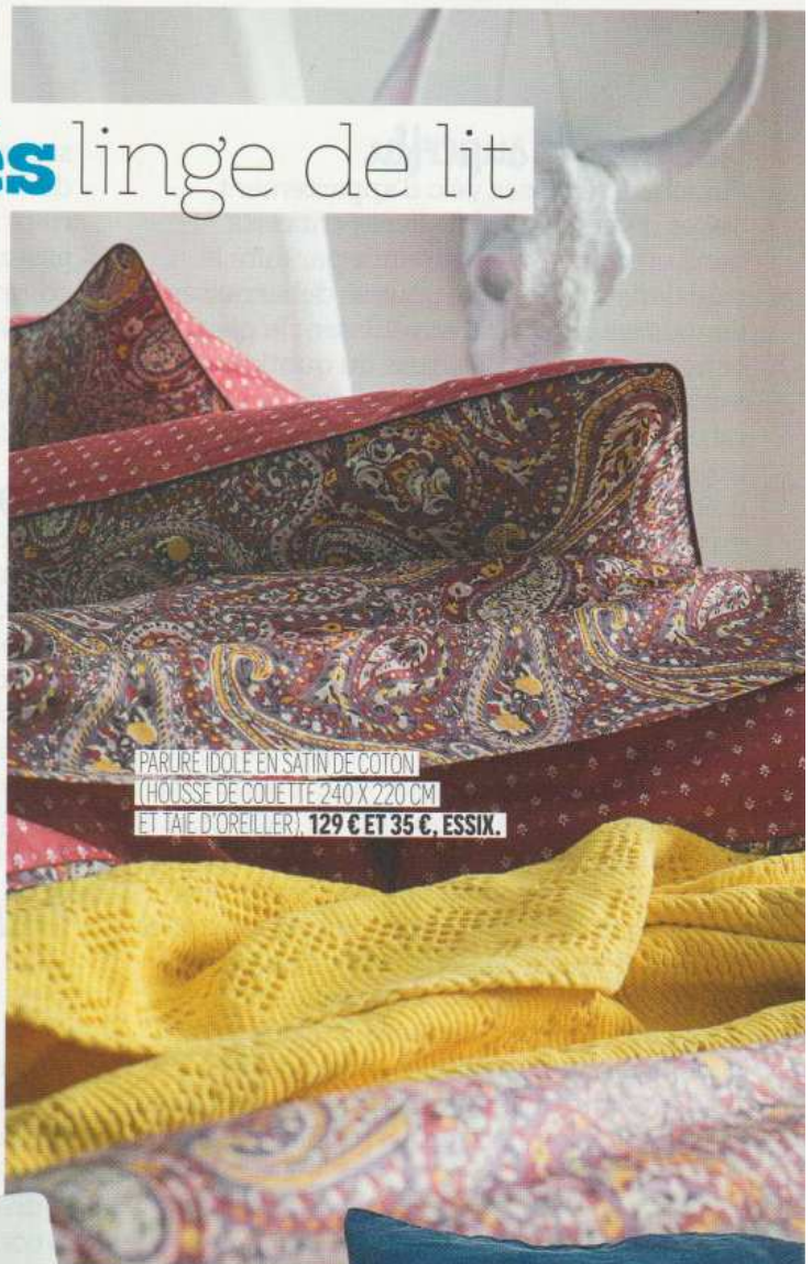
PARURE IDOLE EN SATIN DE COTON (HOUSSE DE COUETTE 240 X 220 CM ET TAIE D'OREILLER), 129 € ET 35 €, ESSIX.