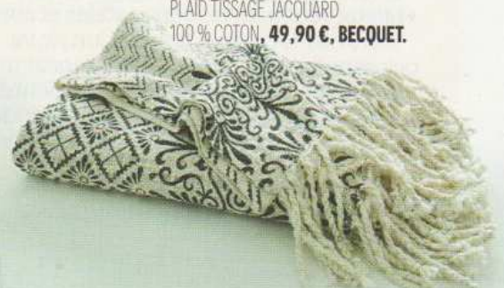
PLAID TISSAGE JACQUARD 100 % COTON, 49,90 €, BECQUET.