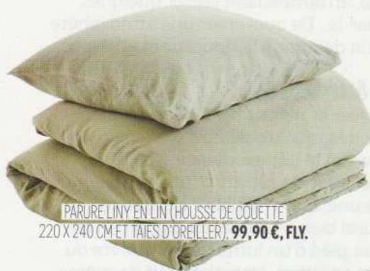
PARURE LINY EN LIN (HOUSSE DE COUETTE 220 X 240 CM ET TAIES D'OREILLER), 99,90 €, FLY.