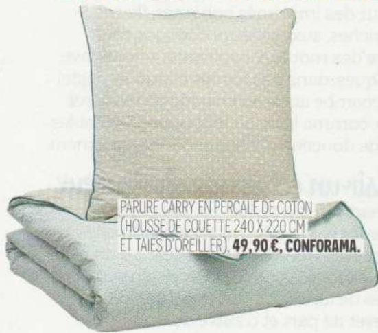
PARURE CARRY EN PERCALE DE COTON (HOUSSE DE COUETTE 240 X 220 CM ET TAIES D'OREILLER), 49,90 €, CONFORAMA.