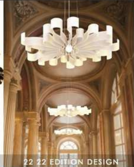
22 22 EDITION DESIGN

Cliquez sur les visuels pour accéder aux sites