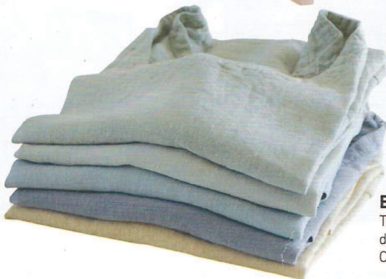
Bien équipé ! Tabliers en chanvre, deux poches, 52 € l'un, Couleur Chanvre.