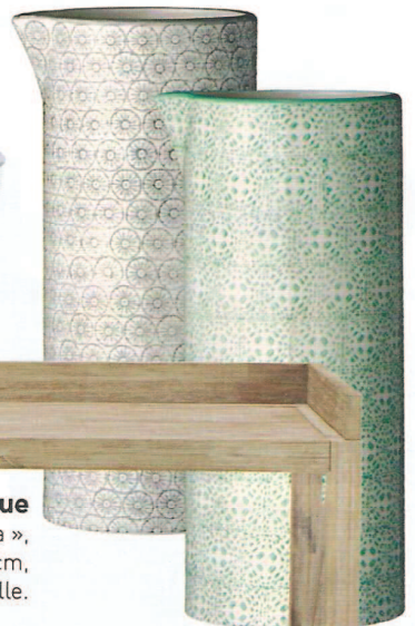
Bucolique Pichets à eau « Isabella », en céramique, Ø 11 x H 25 cm, 35 € l'un, Bloomingville.