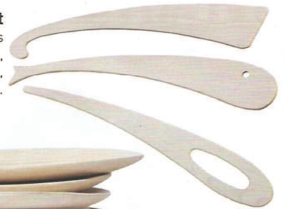
Trio gagnant Spatules en érable, 31 € les trois, C. Quoi.