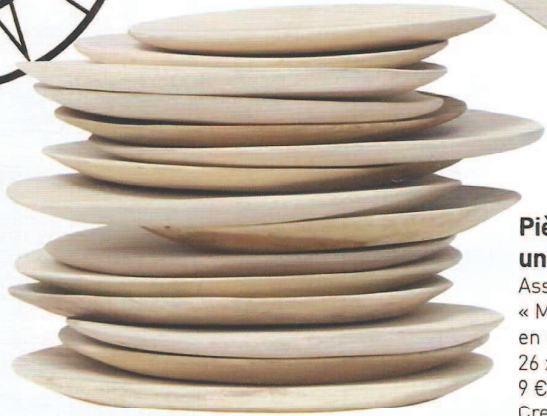
Pièces uniques Assiettes « Mango », en manguier, 26 x 20 cm, 9 € l'une, Love Creative People.