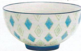
Petit déj Bol en grès, 5,90 €, Monoprix.