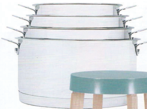
Tous feux Casserolles à poignées amovibles, en acier inoxydable, Ø 14, 16, 18 et 20 cm, 160 € les quatre, Ambiance & Styles.