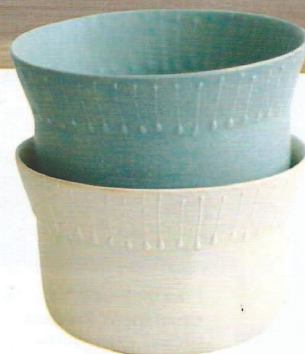
Basiques Bols japonais en porcelaine, 56 € l'un, design Yumiko Iihoshi, Neëst.