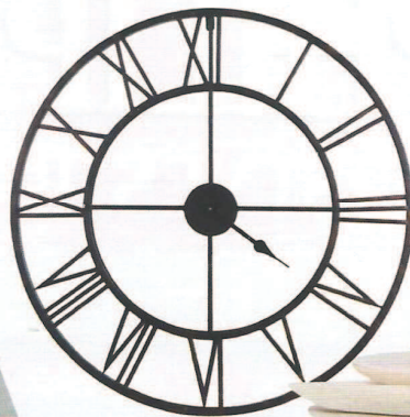
Géante Pendule « Station XL », en fer, Ø 100 cm, 80 €, But.