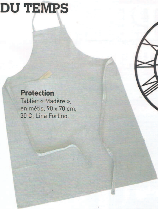
Protection Tablier « Madère », en métis, 90 x 70 cm, 30 €, Lina Forlino.