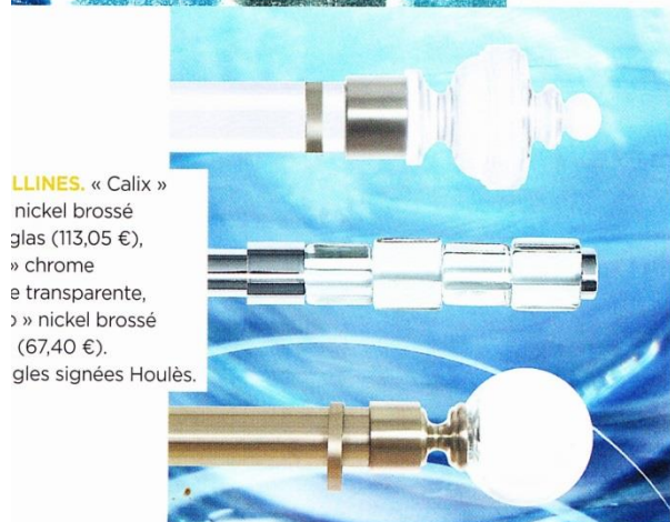
LLINES « Calix » nickel brossé, » chrome et transparente, » nickel brossé (67,40 €). gles signées Houliès.