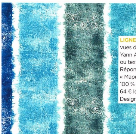
LIGNES D'EAU vues d'avion façon Yann Arthus-Bertrand, ou textile estival? Réponse n° 2, avec « Mapuche » azur, 100 % coton, L 137 cm, 64 € le mètre. Designers Guild.