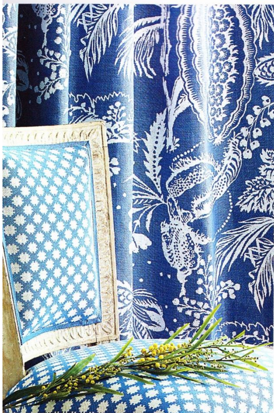
E DES PROFONDEURS assurée devant ce bleu cobalt flore comme mouvante! « Cali Lin » lavande, la fraîcheur 0 % lin. L 126 cm, 131 € le m, Canovas. Chez Pardigon.