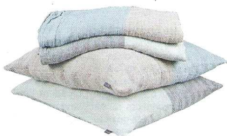
Scapa Home, Marti Linge de lit en lin et coton L. 240cm, l. 160cm (plaid) ; L. 50cm, l. 50cm (coussin) Prix : 44 €

Notre astuce : privilégier les coloris sobres et frais.