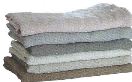
Couleur Chanvre Couvre-lit en chanvre lourd tissé d'une armure jacquard. L. 260cm, l. 250cm Prix : 135 €