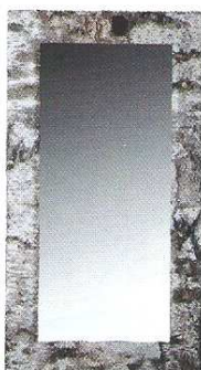
Birch Bark Miroir en marqueterie d'écorce de bouleau et incrustation de cristaux. H. 138cm, l. 73cm Prix : 1 200 €

Notre astuce : éviter de le placer en face du lit (il est rarement motivant de se regarder dormir) ; préférer une installation proche du dressing.