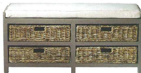
Becquet, Tunia Bout de lit avec rangements en jonc de mer tressé. L. 100cm, l. 35cm, H. 45cm Prix : 199 €