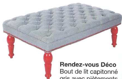
Rendez-vous Déco Bout de lit capitonné gris avec piètements en bois rouge L. 121cm, l. 70,5cm, H. 46,5cm Prix : 355 €

Notre astuce : certains offrent un bac de rangements, pensez-y !