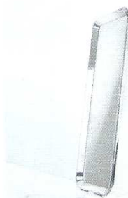
Magis, Déjà-vu Design Naoto Fukasawa Miroir avec cadre d'aluminium extrudé poli et joints en fonte d'aluminium poli. Prix sur demande