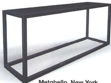
Metobello, New York Bout de lit en acier L. 140cm, l. 40cm, H. 60cm Prix : 699 €