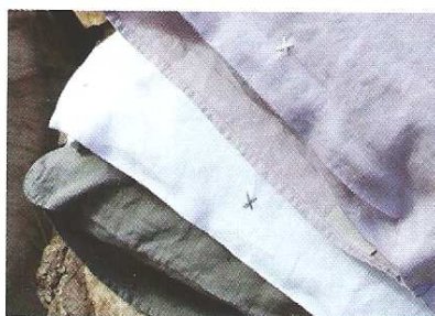
Bed and Philosophy Taies d'oreiller en lin L. 70cm, l. 50cm ; L. 65cm, l. 65cm Prix : à partir de 29 €